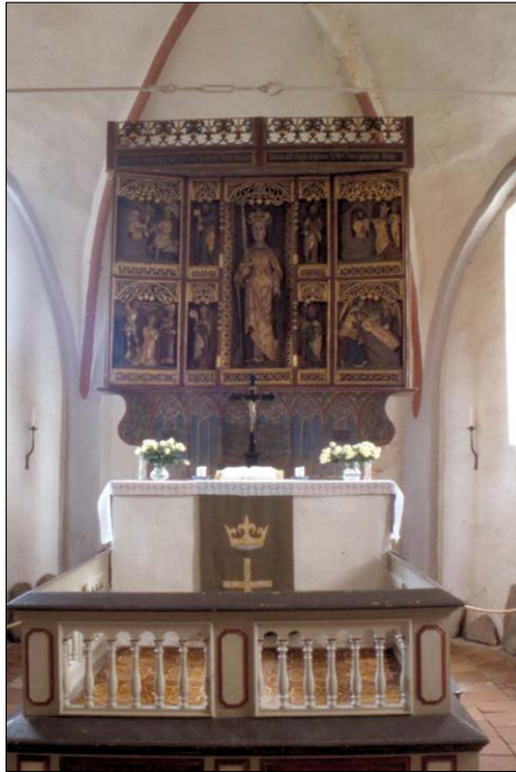
Abb. 7: Katharinen-Retabel der Kirche zu Middelhagen/Rügen (Autor)