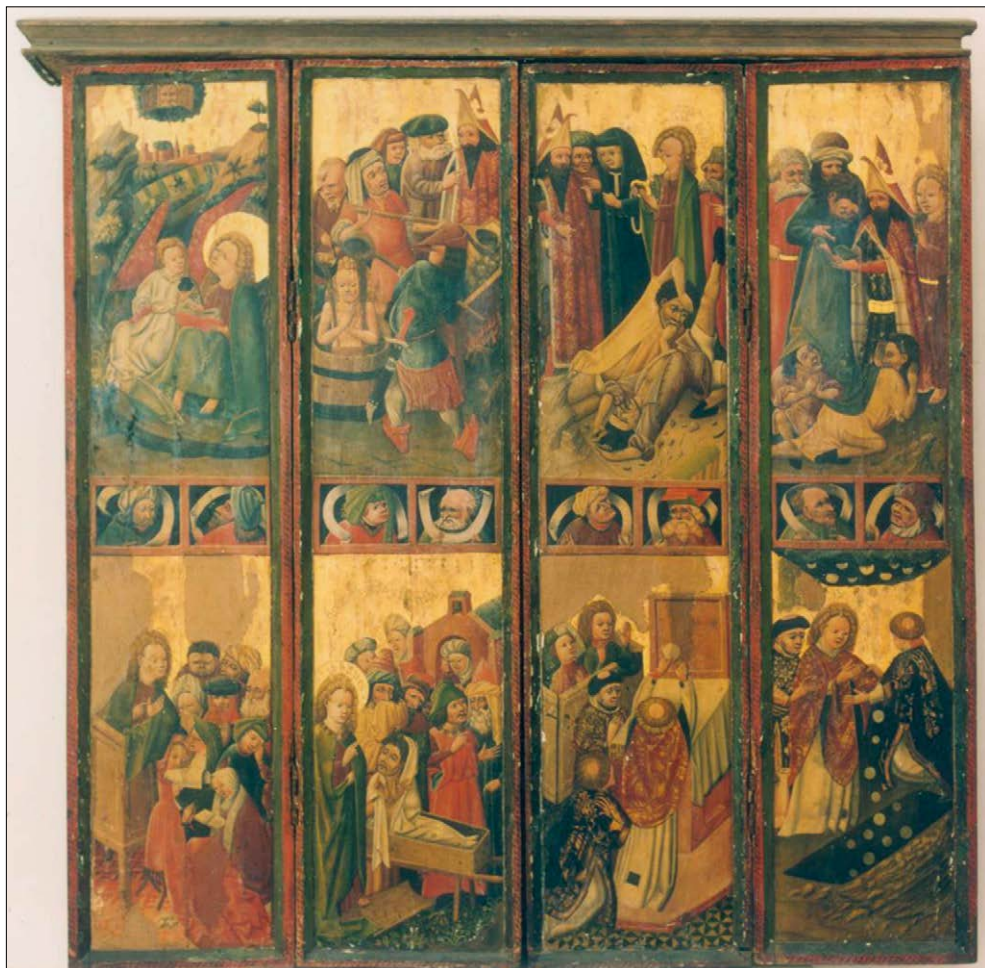
Abb. 9: so genannter Altar der Barbieri (KHM) aus St. Nikolai Stralsund