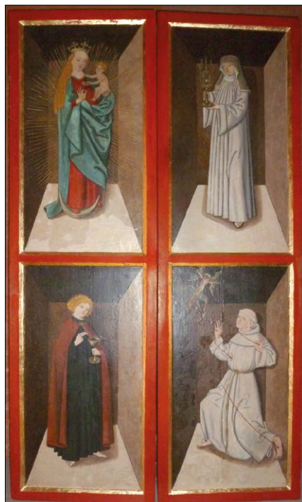
Abb. 5: Franziskus-Retabel aus Sanzkow (Dipl. Rest. Wolfram Vormelker, Rostock)