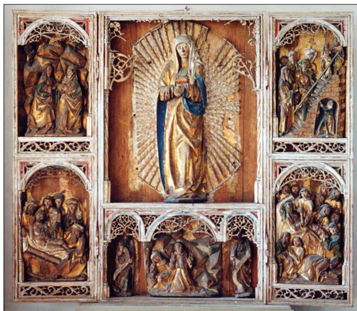
Abb. 6: Franziskus-Retabel Mittelschrein Schmerzensmutter (Autor)