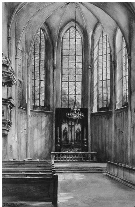
Abb. 4: Chor St. Johannis um 1900, Aquarell von Bruno Richter (KHM Fotoarchiv)