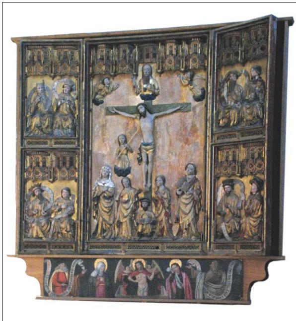
Abb. 8: so genannter Altar der Riemer und Beutler St. Nikolai Stralsund