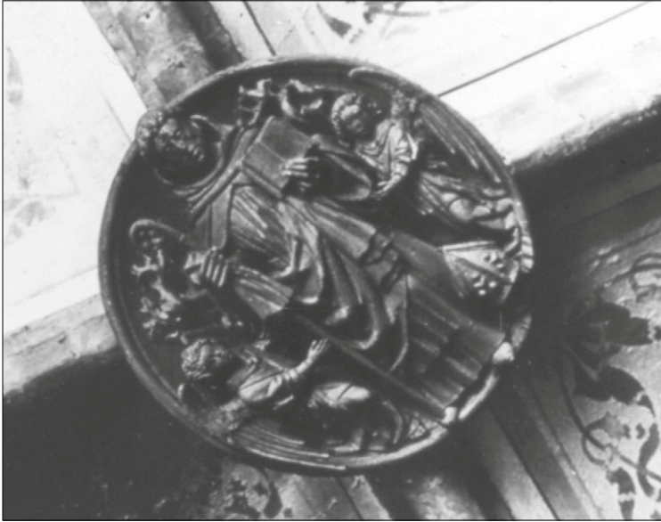
Abb. 2: Dominikus-Scheibe am Schluß-Stein um 1900